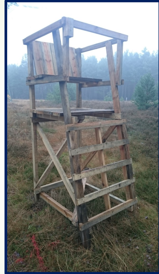
Groß Kreuz, 9. September 2023